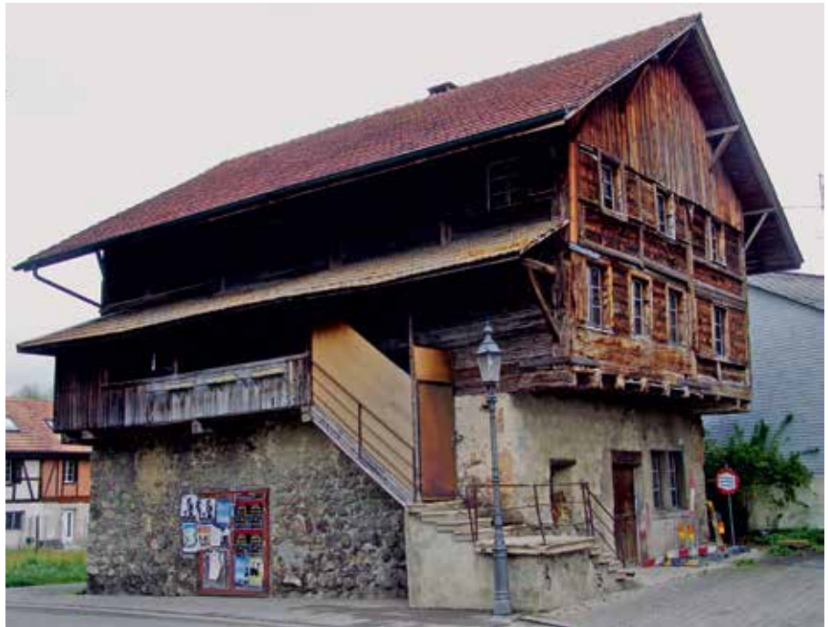
Die Alte Schmitte: Der Bau stammt wie der Turm aus dem 13. Jahrhundert. (Ulrich Kinder, 2014)

ben Zeit erlosch der Einfluss des früheren Propstes Ulrich von Kyburg (Bischof von Chur 1233–† 1237) auf das Stift Beromünster. Kyburg hatte damit an Terrain verloren und keinen Stützpunkt mehr, der einen direkten Zugriff auf die Herrschaftsrechte im Seetal ermöglichte. Aus diesem Grund erbauten sie die Burg Richensee. Nach dem kyburgischen Dienst-