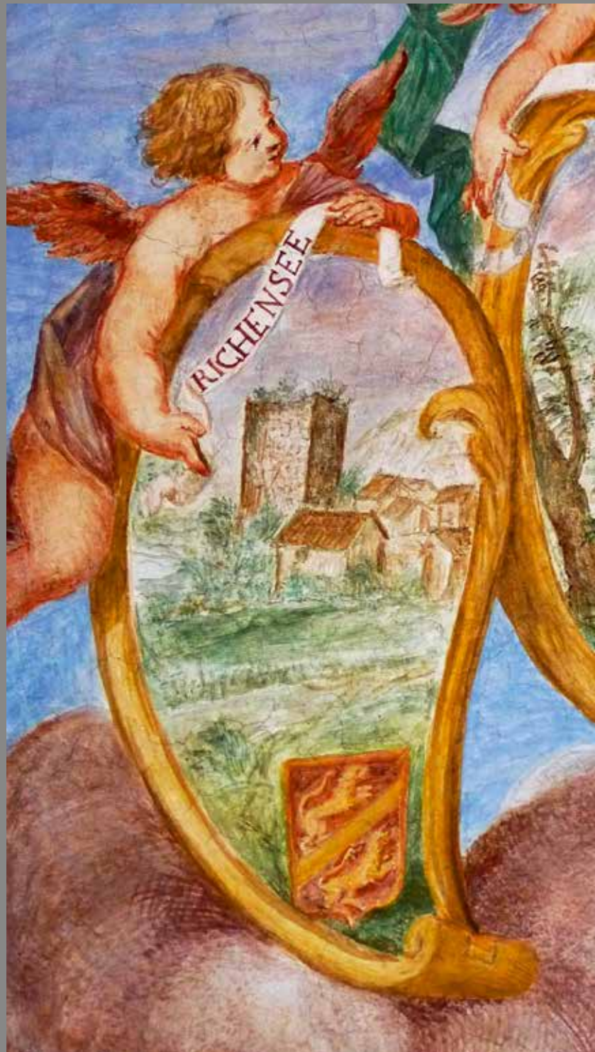
Der Turm von Richensee: Ausschnitt aus dem Fresko im Festsaal des Schlosses Heidegg von Francesco Anto- nio Giorgioli von 1702. (Peter Niederhäuser, 2014)